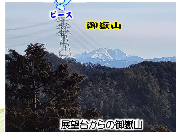
展望台からの御嶽山