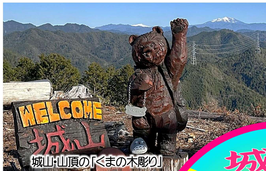
城山・山頂の「くまの木彫り」