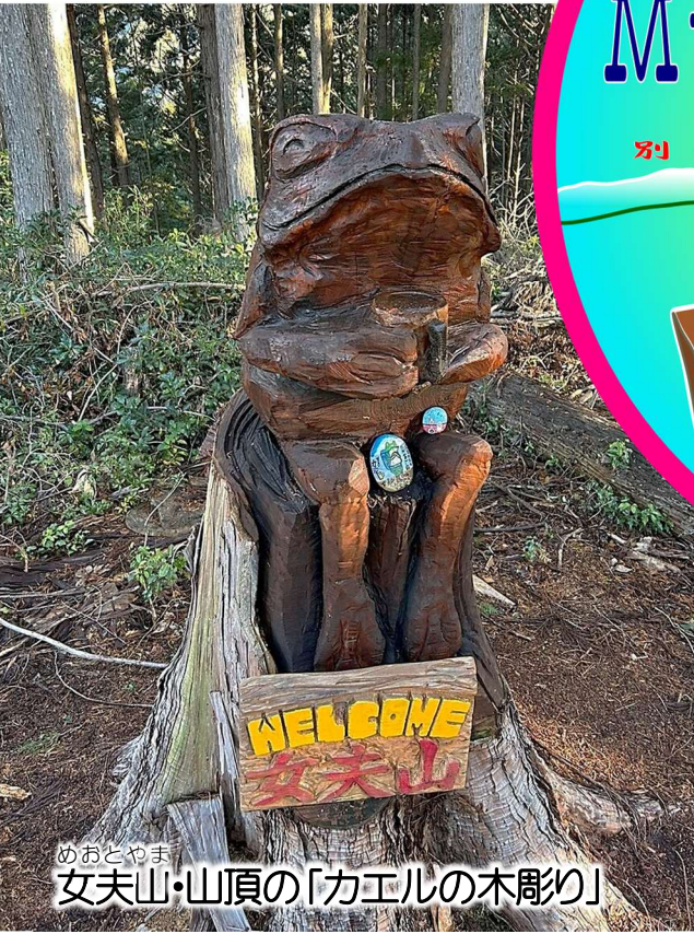
めおとやま 女夫山・山頂の「カエルの木彫り」