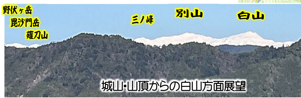
城山・山頂からの白山方面展望