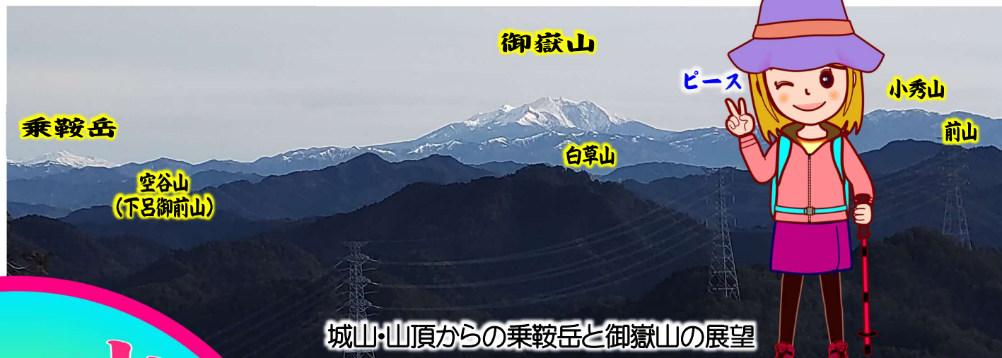
城山・山頂からの乗鞍岳と御嶽山の展望