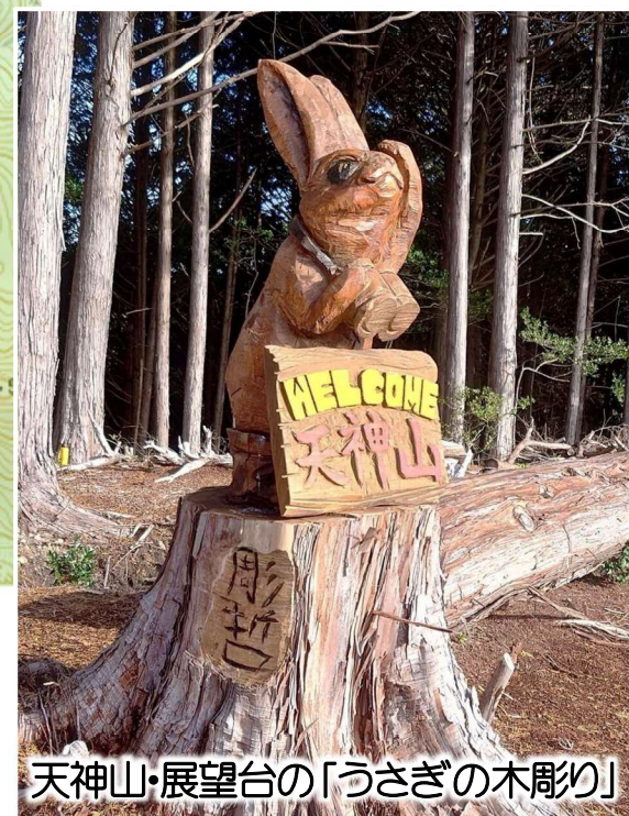
天神山・展望台の「うさぎの木彫り」