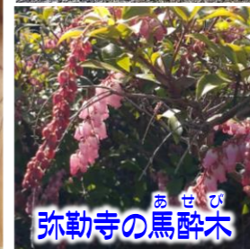
あせび 弥勒寺の馬酔木