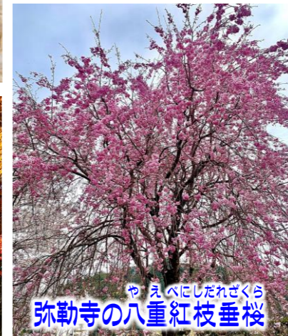
やえべにしたらざくら 弥勒寺の八重紅枝垂桜