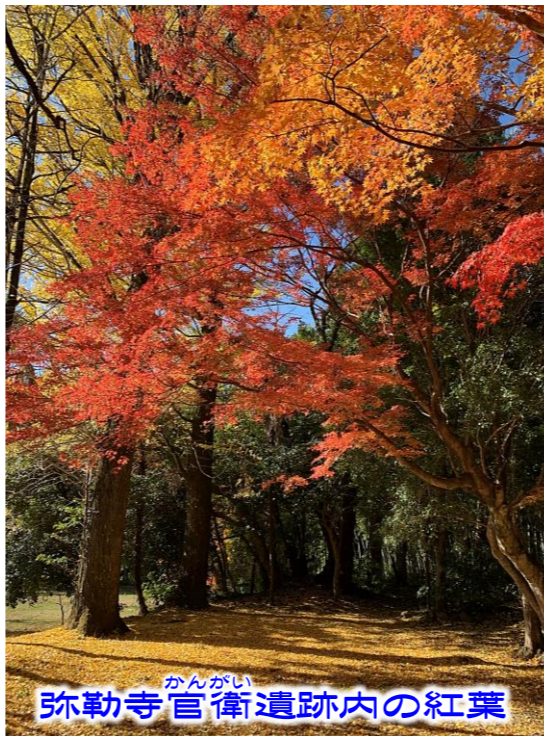
かんがい 弥勒寺官衛遺跡内の紅葉