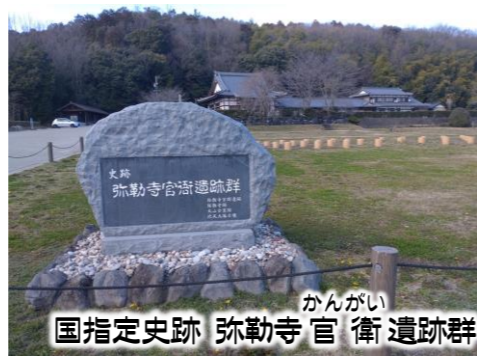
かんがい 国指定史跡 弥勒寺官衛遺跡群