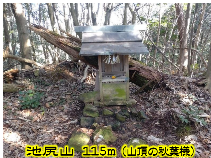
池尻山 115m (山頂の秋葉様)