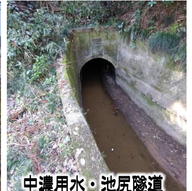
中濃用水・池尻隧道