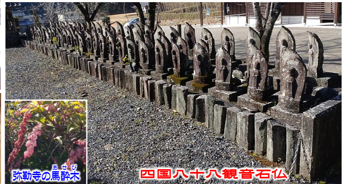
四国八十八観音石仏