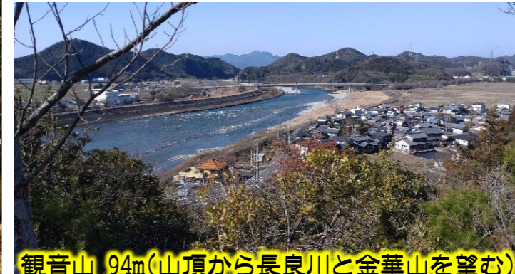
観音山 94m(山頂から長良川と金華山を望む)