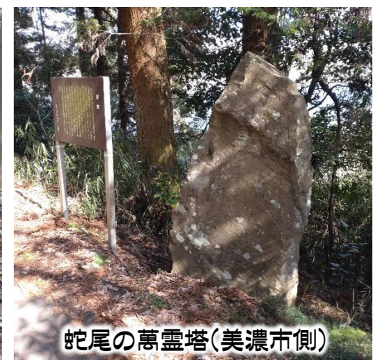
蛇尾の萬霊塔(美濃市側)

「関市の山」のマップ情報、関市民トレッキング教室案内、関山岳会の活動報告などをLINEオープンチャットにて発信します。現在、関山岳会では、会員を募集しております。LINEオープンチャットからも入会を受け付けております。