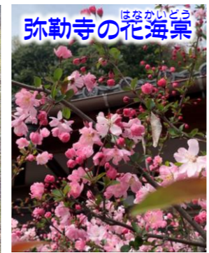
ほろかいどう 弥勒寺の花海棠